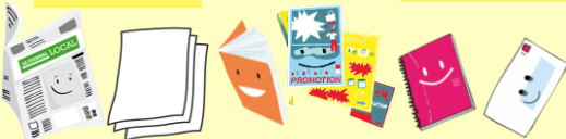
Tous les papiers (sauf les absorbants)