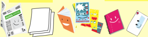
Tous les papiers (sauf les absorbants)